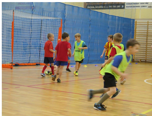
Na zdj. najmłodsze grupy szkoleniowe MOSiR Bochnia w sezonie 2016/17 Żaki – Skrzaty