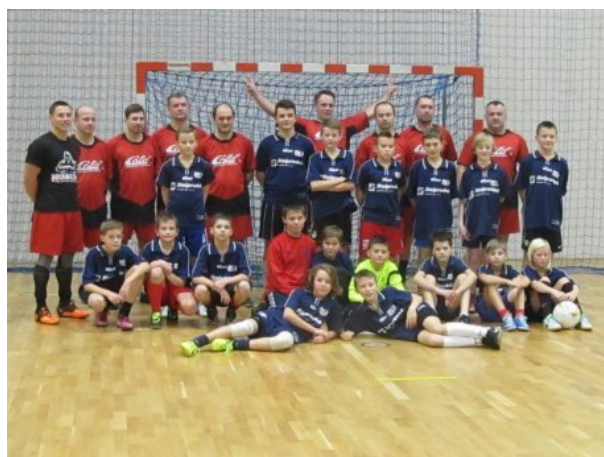
Na zdj. uczestnicy Mikołajkowego Turnieju „Ojciec i Syn” 2013.