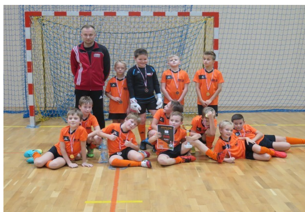
Na zdj. zespół Orlików MOSiR Bochnia, zdobywca II miejsca w w Halowym Turnieju Piłki Nożnej Chłopców (z r. 2007) Bownet CUP, listopad 2016.