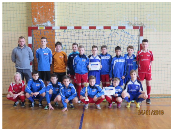
Na zdj. piłkarze podczas treningów w zimie 2016 r. i zespół młodzików, zdobywca I miejsca w lidze halowej Podokręgu tamtego sezonu.