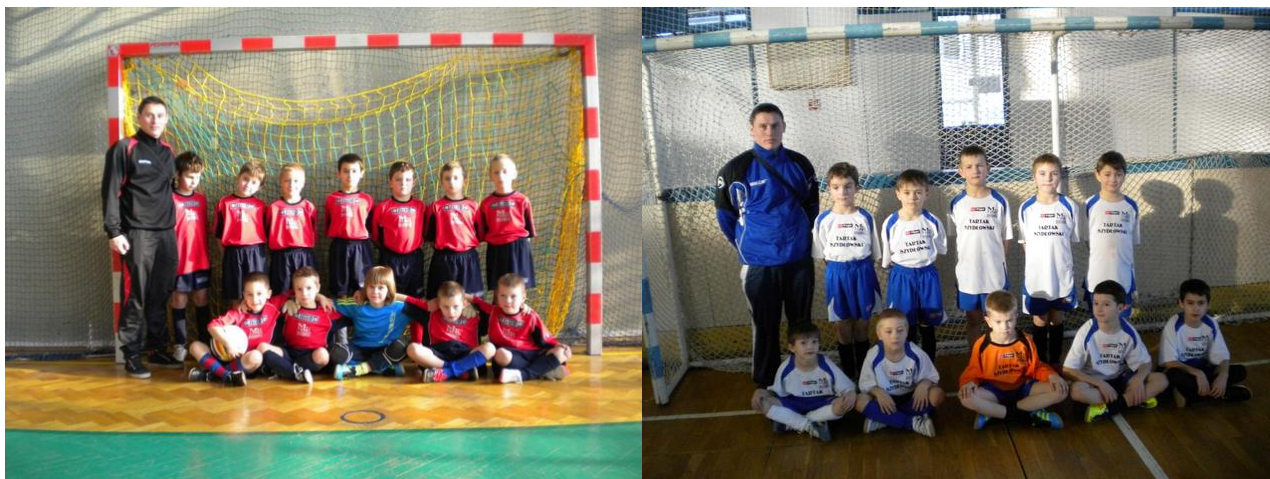
MOSiR Bochnia rocznik 2004/2005 (z lewej) i r. 2003/2004.

Pod koniec stycznia 2012 r. najmłodsi piłkarze nożni (r. 2004 i mł.) na Turnieju Piłkarskim ABC Futbolu zdobyli II miejsce, a w VI Turnieju im. Antoniego Barwińskiego – chłopcy rocznik 2003 uplasowali się na VII miejscu.