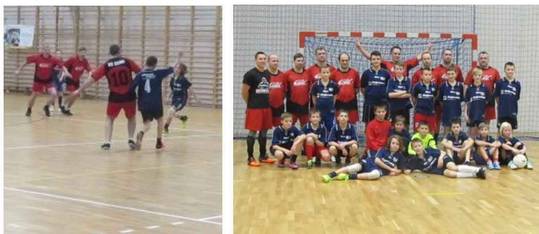
Na zdj. uczestnicy Mikołajkowego Turnieju „Ojciec i Syn” 2013.

Niesamowity klimat mają cieszące się wielką popularnością Turnieje „Ojciec i Syn”, gdzie kibicujące mamy i zarazem żony mają ogromny problem po której stronie się opowiedzieć:-)