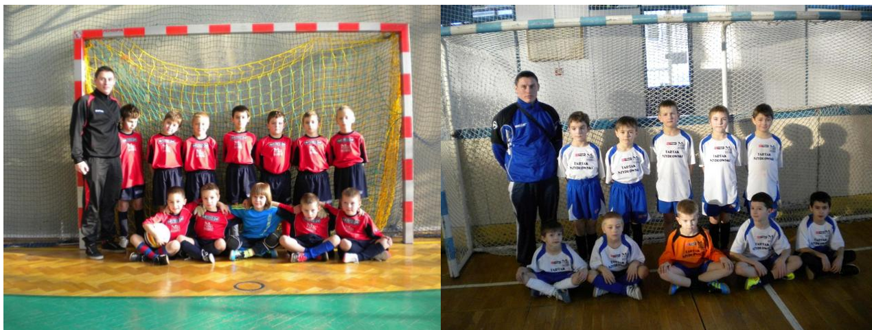
MOSiR Bochnia rocznik 2004/2005 (z lewej) i r. 2003/2004.

Pod koniec stycznia 2012 r. najmłodsi piłkarze nożni (r. 2004 i mł.) na Turnieju Piłkarskim ABC Futbolu zdobyli II miejsce, a w VI Turnieju im. Antoniego Barwińskiego – chłopcy rocznik 2003 uplasowali się na VII miejscu.